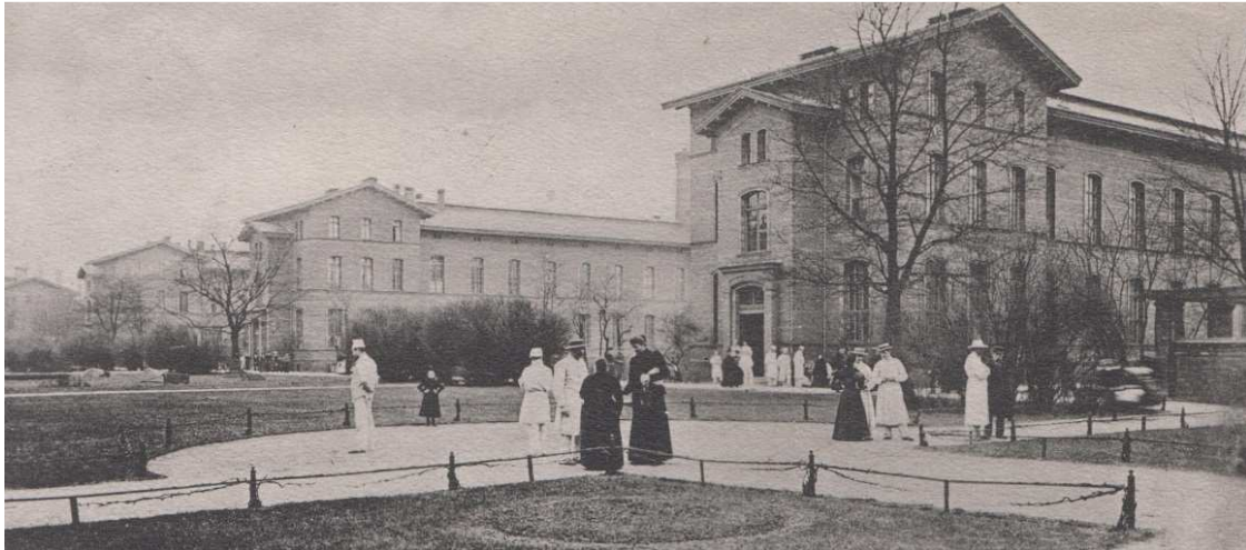
Blick in die zentrale Parkanlage des Pavillonkrankenhauses am Friedrichshain in Berlin (1868-1874). Ansichtskarte des Berliner Kunstverlages Julius Goldiner nach einer Fotografie von 1908.