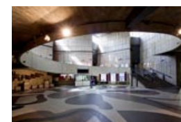
Facultad de Geológicas Oviedo - Espagne Ignacio Alvarez Castelao arch.

http://www.cscae.com/images/stories/Noticias/colocacion_placas_DOCOMOMO_prensa_2014.pdf