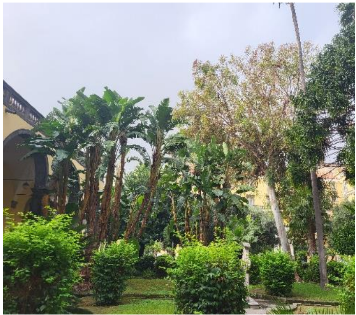
A kolostor kertje