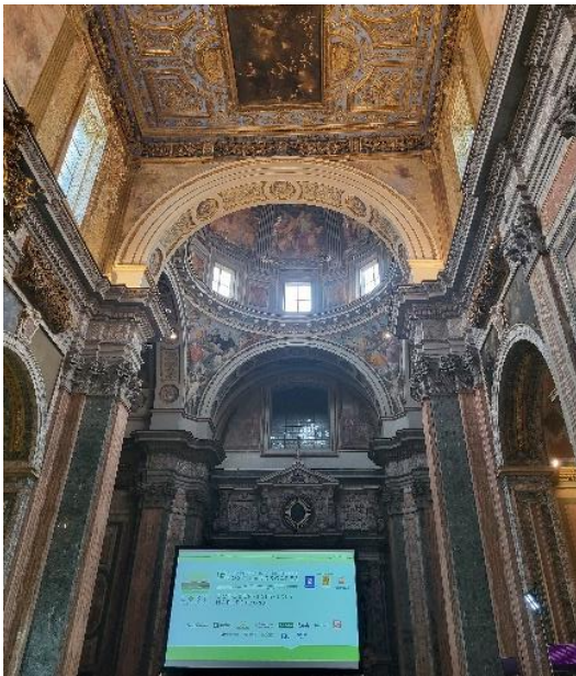
A konferencia helyszíne a kolostor temploma volt