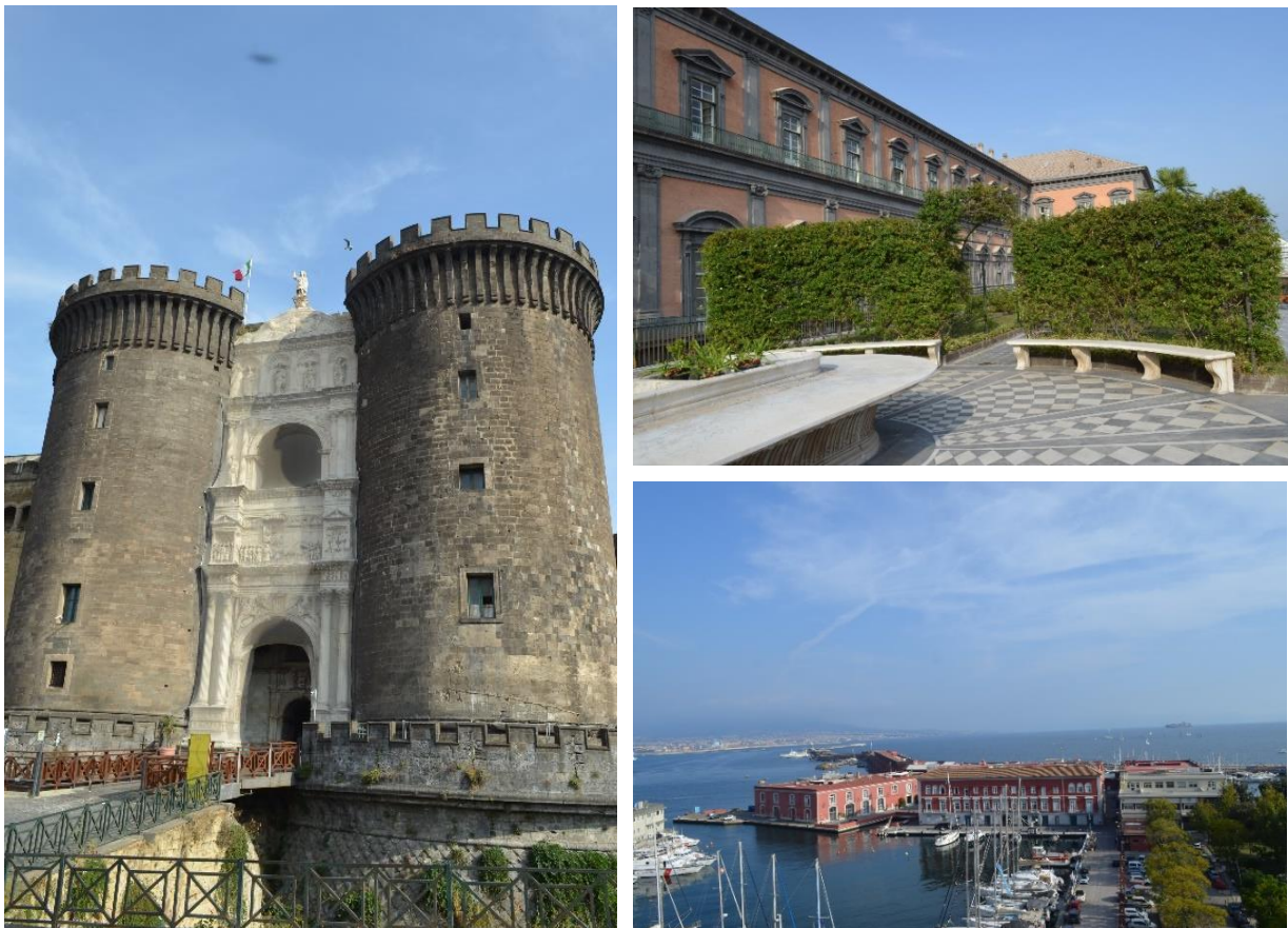
A királyi vár és annak függőkertje, illetve a kilátás a függőkertből

A szakmai konferencia záróakkordjaként a mintegy kétszáz résztvevő több csoportban, szakmai vezetés mellett, meglátogatta a nápolyi királyi palotát, illetve annak függőkerjzeit.