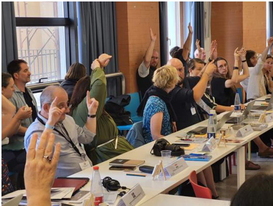
A küldöttek szavaznak

Két olyan napirendi pont volt, amely heves vitát váltott ki. Az egyik a tagdíj emelést. Az elmúlt 10 évben nem történt meg a tagdíjak korrekciója, ezért a kincstárnok 10% tagdíj emelésre tett javaslatot, ami a magyar tagdíj esetében 142,25 € emelést jelent jövőre. Az IFLA Europe éves működési költsége 180.000€ körül van, és a szövetségnek van egy éves működést fedező megtakarítása is, de az idei évre prognosztizált 2000 € körüli „nyereség” jövőre a költségek várható emelkedése és a szponzori bevételek kiszámíthatatlansága miatt „veszteségbe” fordul. A leghevesebben a német képviselő tiltakozott, mivel náluk már elfogadásra került a jövő évi költségvetés, amiben nem szerepel ez a költség. Ő több lépcsős, évenkénti 5-5%-os emelést javasolt.