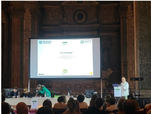
A magyar Pecha-Kucha prezentáció