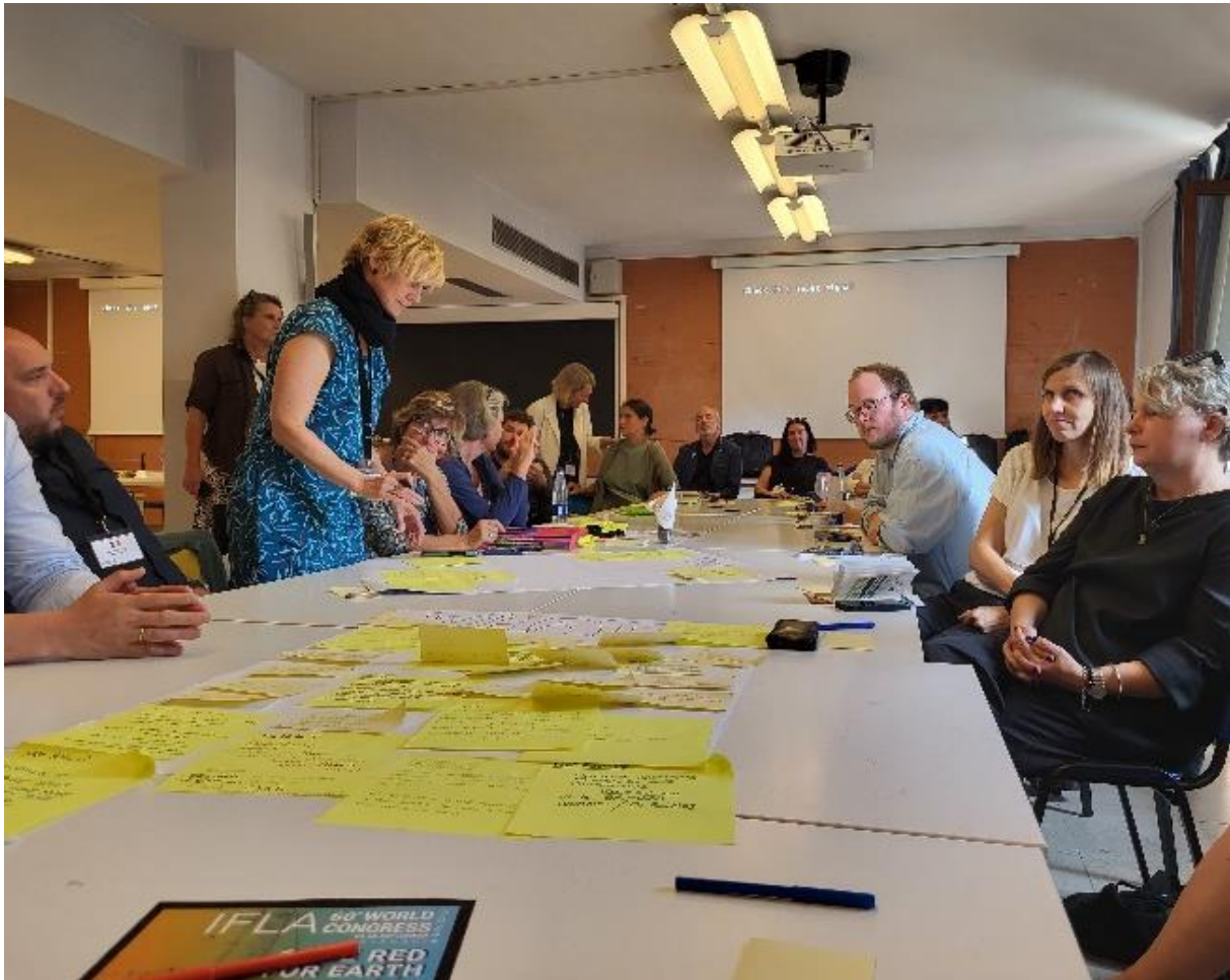
A workshop folyamata

A másik napirendi pont amely sok vitát kavart a jövő évi közgyűlés helye. Az előzetes egyeztetéseknek megfelelően jövő novemberben Izrael adna-adott volna helyet a közgyűlésnek, de a háború miatt sajnos küldöttjük személyesen nem tudott jelen lenni, így távollétében zajlott a vita. Mivel a jelenlegi konfliktus végét senki sem látja, és azt sem látja senki mikor lesz Izrael újra biztonságos, az a döntés született, hogy december 15.-ig kivárunk, azután az elnökség eldönti, hogy mi történjen, de közben B tervként a 2025-ös gyűlés szervezője, Belgium felkészül arra, hogy szükség esetén 2024-be Brüsszelben legyen egy konferencia nélküli közgyűlés.